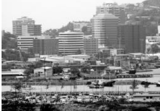
Hauptstadt Port Moresby

der aber für den Abbau der Bodenschätze radikal abgeholzt wird. Noch bestehen ein großer Reichtum und eine Vielfalt an Tieren und Pflanzen, die aber durch die Abholzung bedroht sind. Es herrscht ein heißes und feuchtes Klima, das durch die Nähe zum Äquator bedingt ist. Da das Landesinnere Papua-Neuguineas durch hohe Gebirgszüge geprägt ist (bis zu 4.000 m), variiert das Wetter innerhalb der Insel. In den Küstenregionen bleibt es gleichmäßig heiß bei einer Durchschnittstemperatur von ca. 30°C, während im Hochland die Tage bei ca. 28°C liegen und die Nächte kühl sind. Die Jahreszeiten bestehen aus Regen- und Trockenzeiten. Im Hochland kommt es oft zu Unwettern, an der Küste toben häufig Hurrikane.