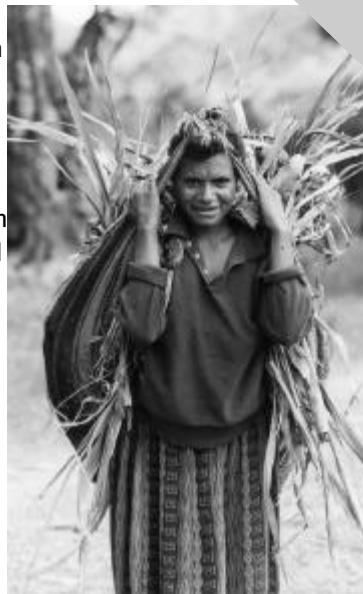
Frau mit Bilum