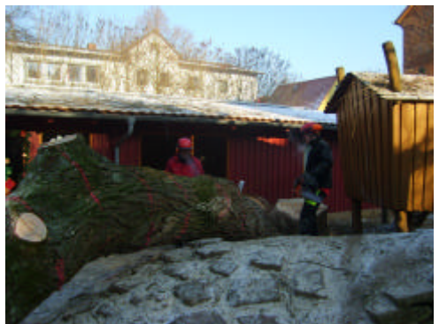
Fällaktion der Firma Breithaupt, Michelstadt

Ein altes Wahrzeichen im Kindergartenhof wurde Anfang des Jahres gefällt. Die große Trauerweide hatte bei Umbauarbeiten im Hof Schaden erlitten. Das Grafenhaus will im Frühjahr eine junge Weide pflanzen.