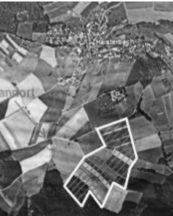
Die räumlichen Ausmaße des Projekts im Luftbild.