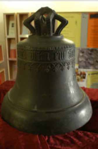
Die Glocke von 1529, vor der Überführung ausgestellt in der evangelischen Stadtkirche

Der Lauerbacher Friedhof hat nun endlich auch eine eigene Glocke. Im Zuge der Renovierung machte sich der Historische Verein